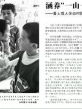
名师工作室成员开展教研活动，提升教学水平。