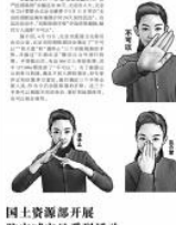
北京市控烟协会发布的“控烟手势”评选结果。