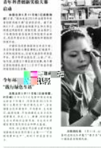
晋大师生助力乡村振兴，为乡村发展贡献力量。

国土资源部近日开展了防灾减灾日系列活动，旨在提高公众的防灾减灾意识和能力。活动包括防灾减灾知识宣传、应急演练等。 国土资源部表示，将进一步加强防灾减灾工作，提高地质灾害防治水平，保障人民群众生命财产安全。同时，也将加大宣传力度，普及防灾减灾知识，提高全民的防灾减灾意识。